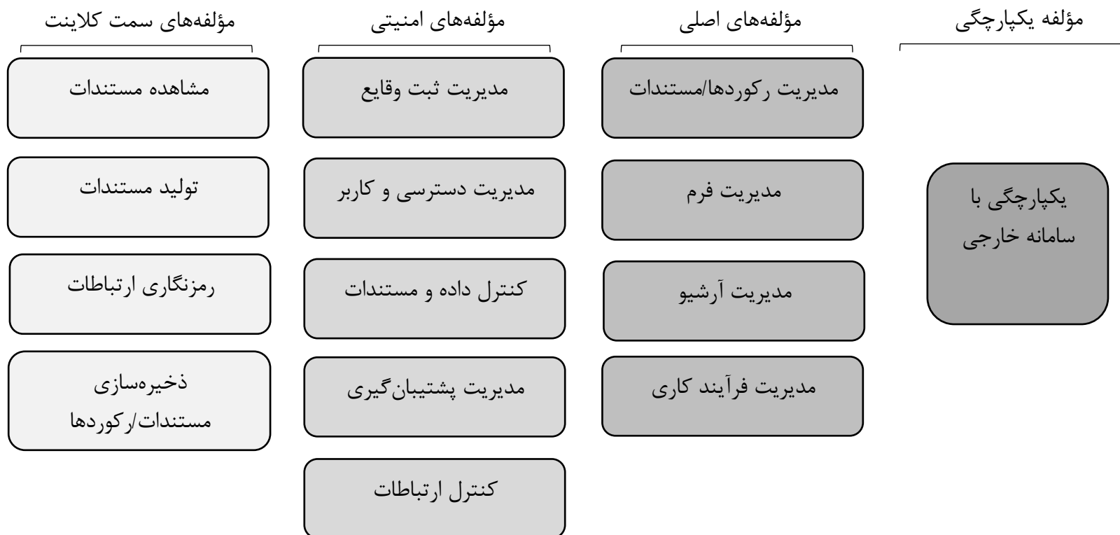
شکل ۱: مؤلفه‌های برنامه کاربردی تحت شبکه